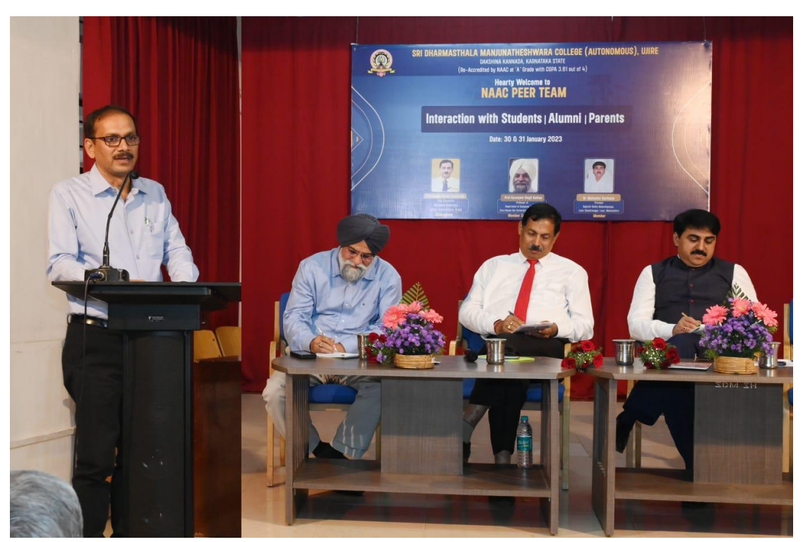
NAAC TEAM ALUMNI INTERACTION

(Autonomous), Ujire-574 240, Dakshina Kannada, Karnataka State